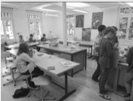
Raum Textiles Gestalten

Die Kinder fühlen sich hier wohl und gewöhnen sich allmählich an die Verschiebung des Unterrichts in das Kirchgemeindehaus, welches vor langer Zeit bereits als Schulhaus benutzt wurde.